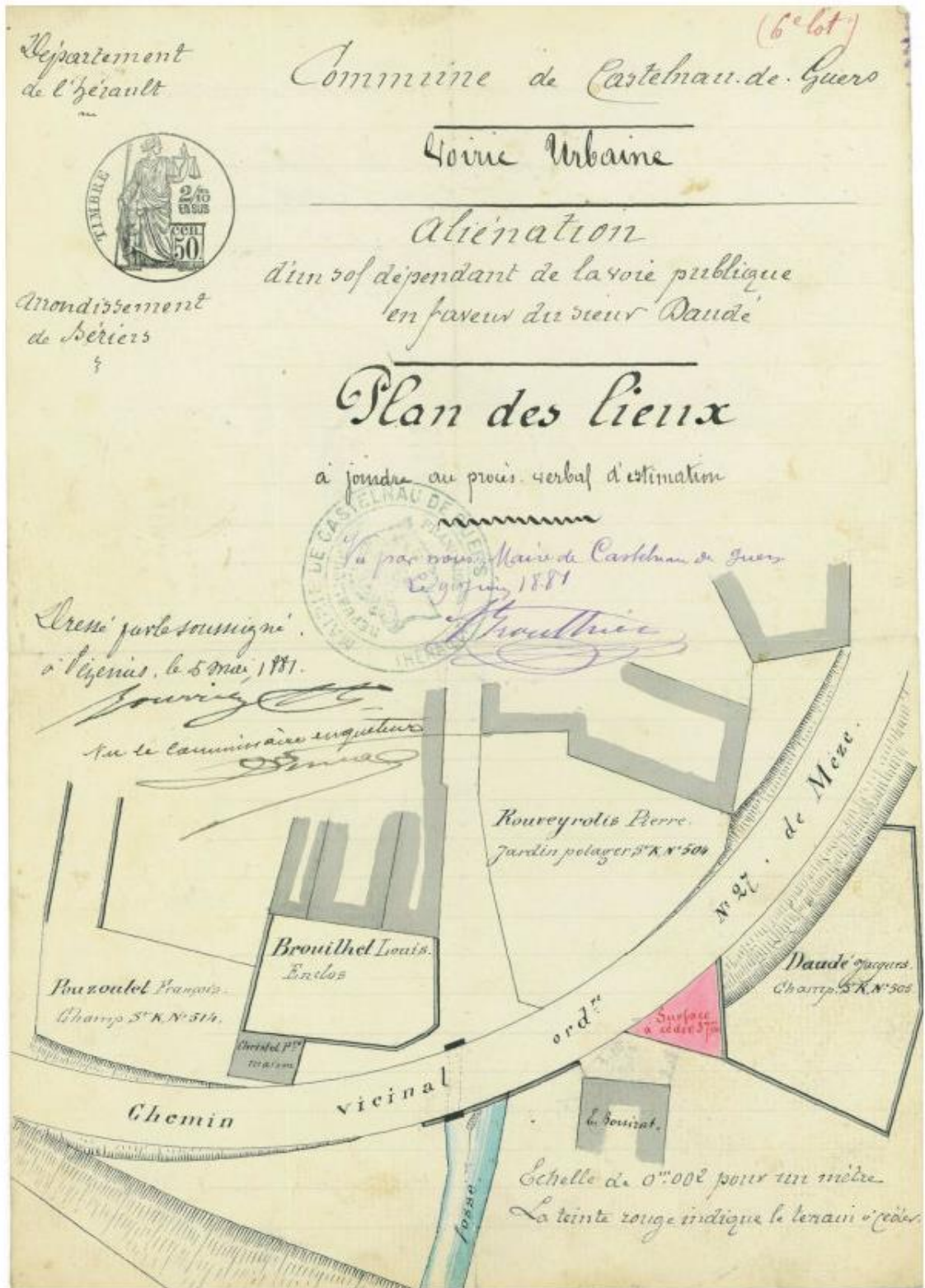
Plan d'un terrain à aliéner (1881)