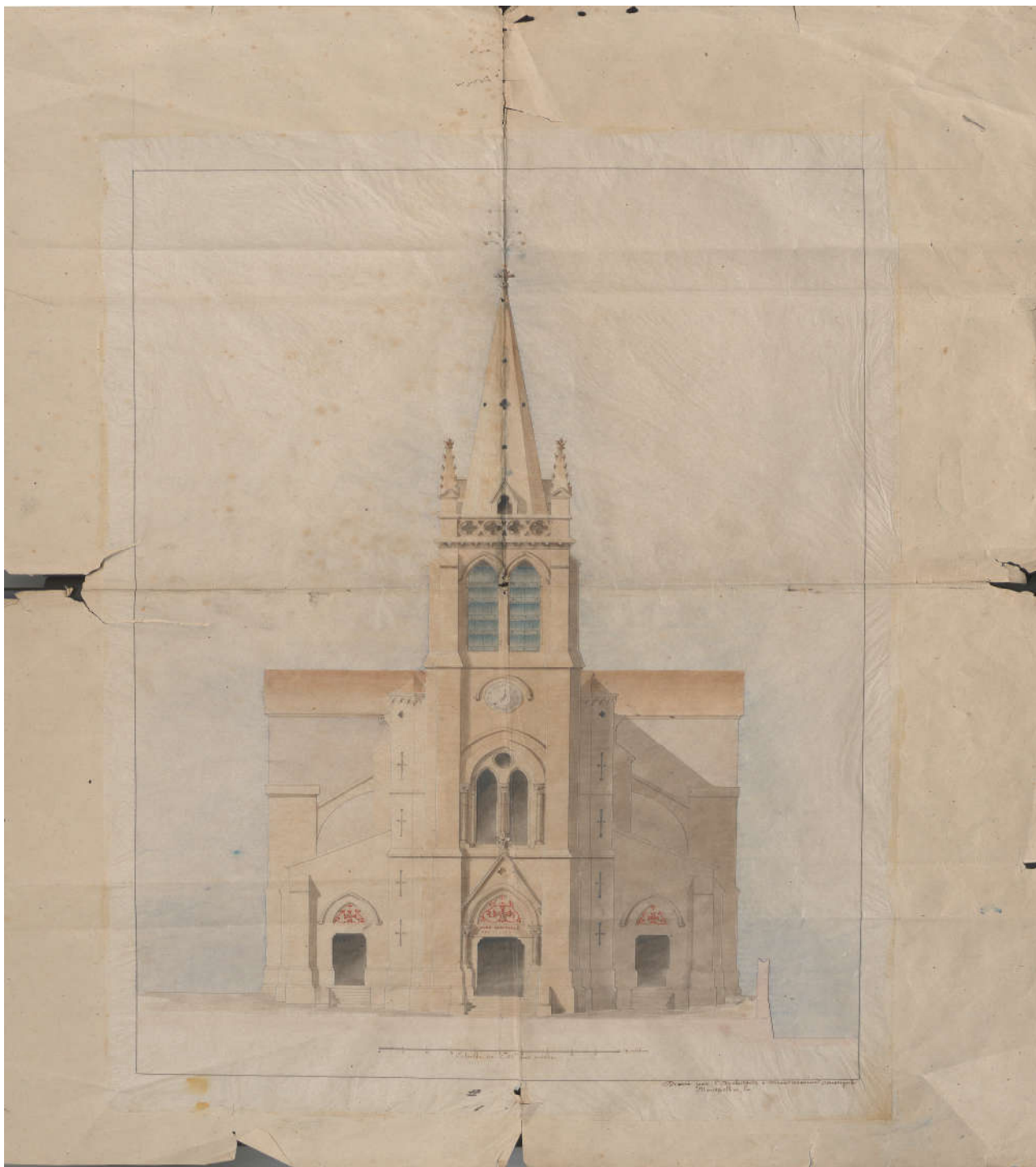
Plan de rénovation de l'église de Castries, 1858-1862 (2M2)