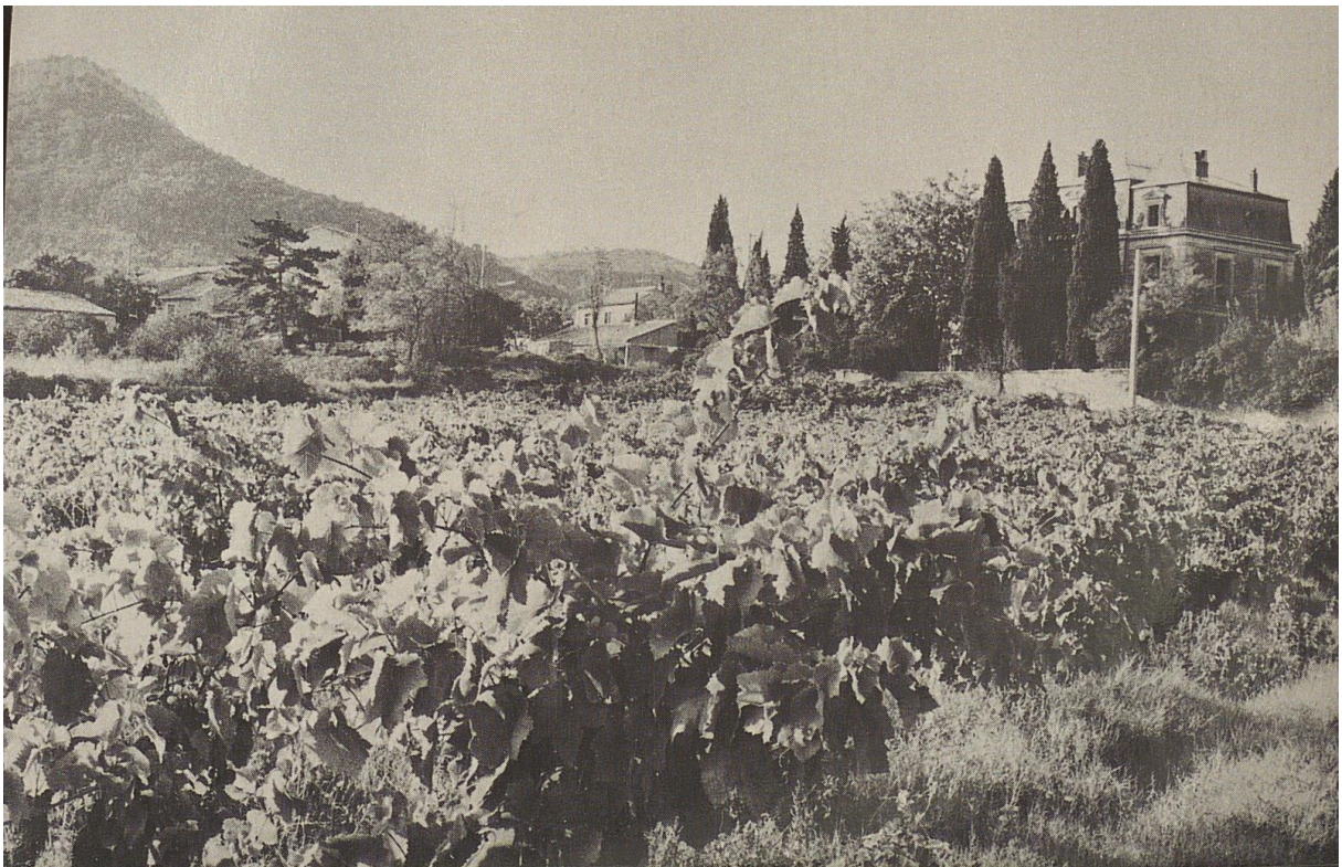
3R1 - CARTES POSTALES DU VILLAGE DE LAURET [ANNEES 1960]