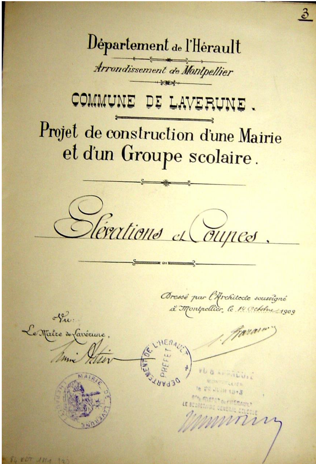
1 M 1 Projet de construction d'une mairie et d'un groupe scolaire : plan de la façade (1909)