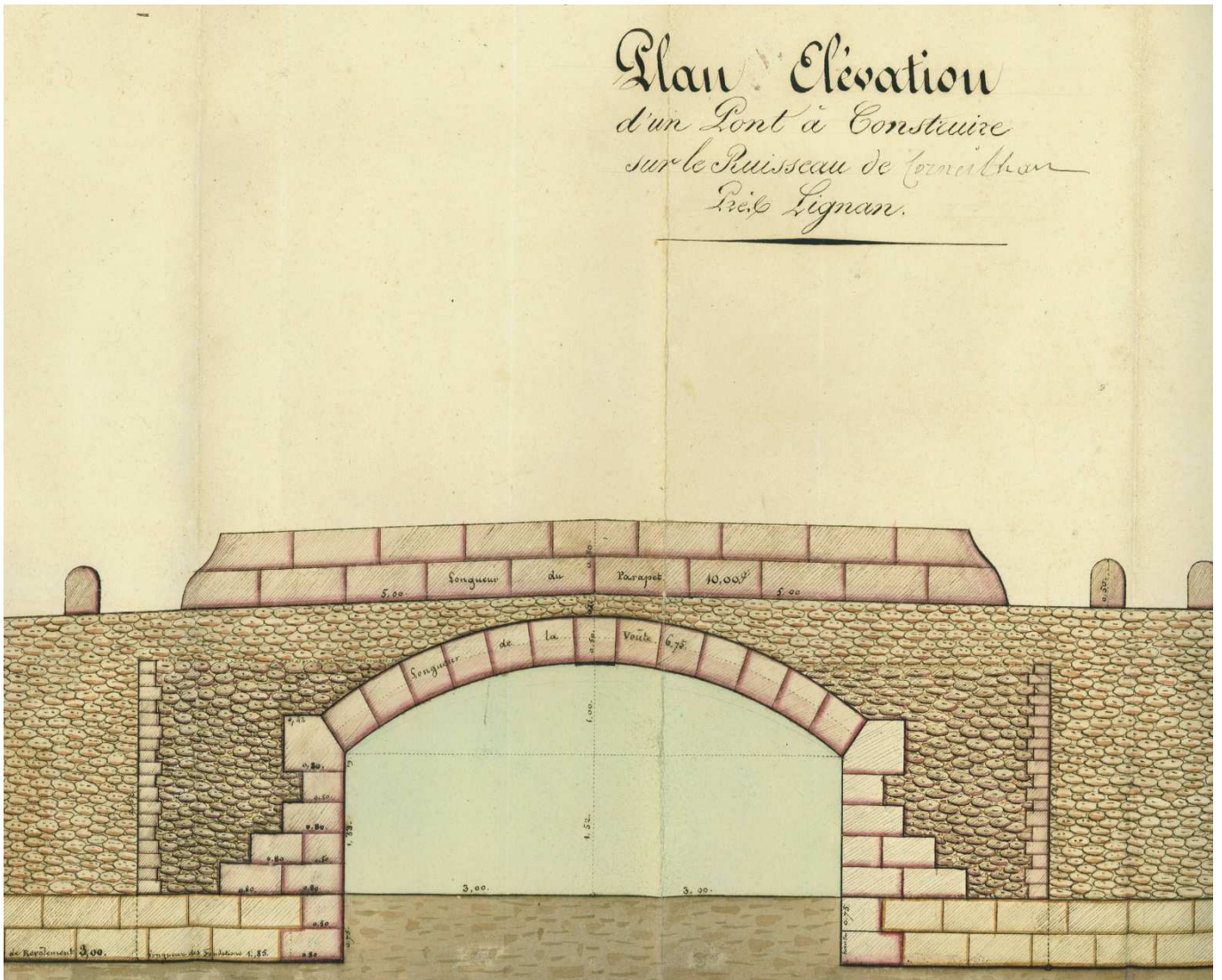
Reconstruction d'un pont sur le ruisseau de Corneilhan (1840) 303