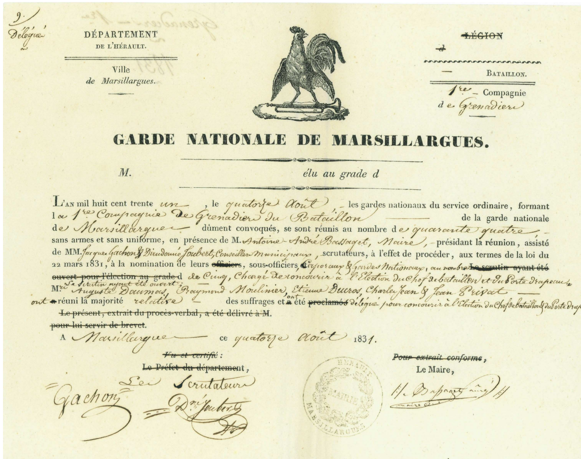
Procès-verbal de nomination de délégués de la garde nationale (1831) 3H5