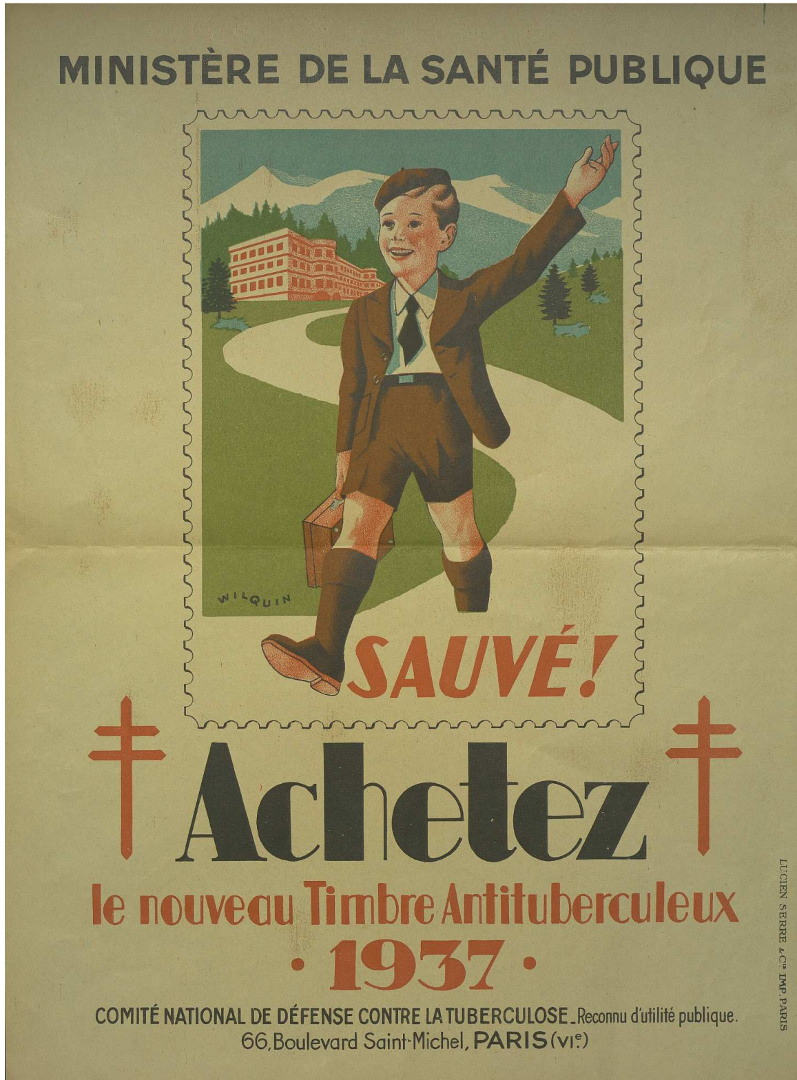
Affiche de la campagne nationale de collecte contre la tuberculose, 1937 (2 | 4)