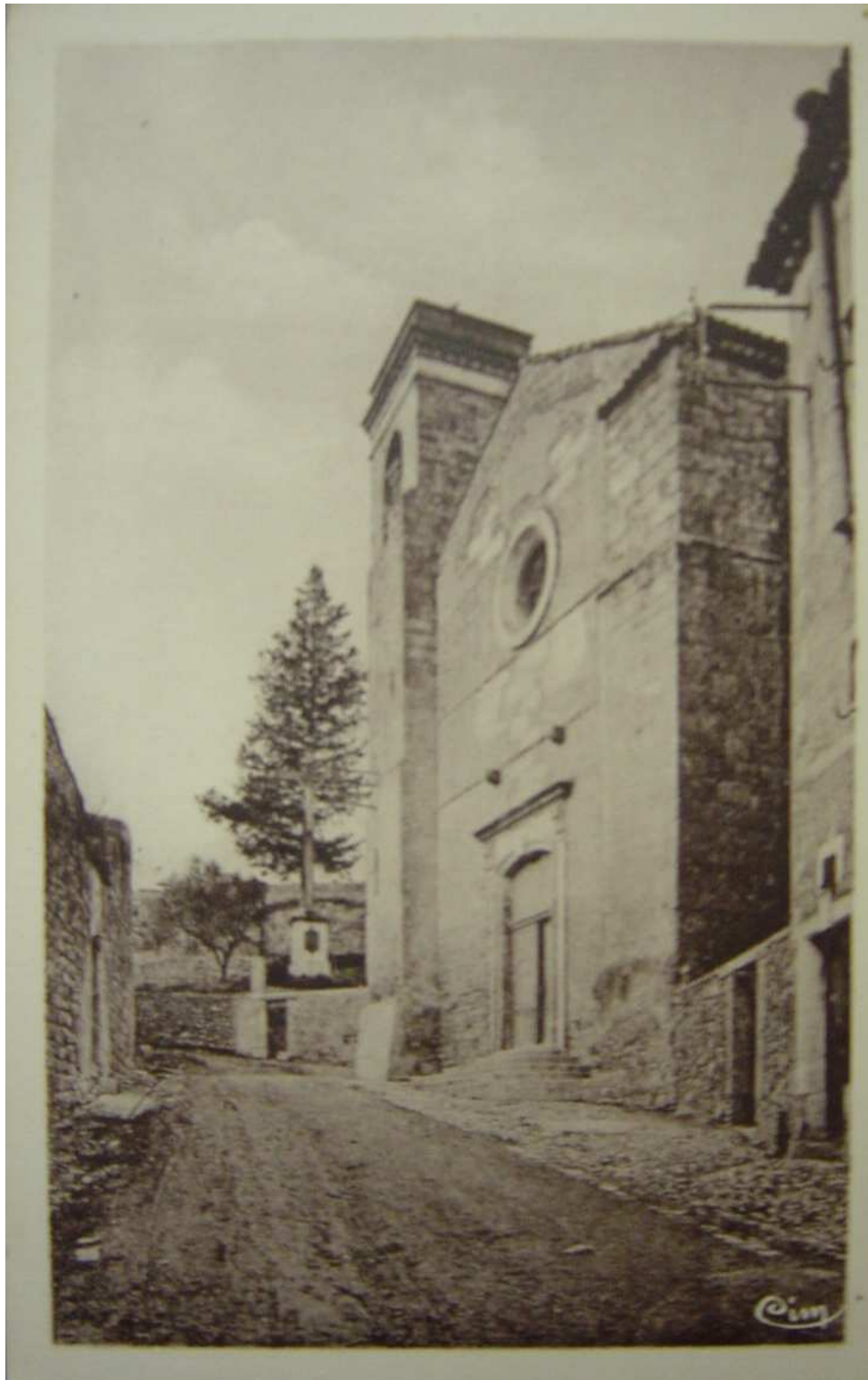
Eglise de Nébian Carte postale [début XX ème siècle] (2 M 1)